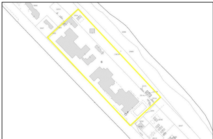
Stralcio planimetria catastale Lotto A

Il complesso immobiliare risulta inserito nel vigente P.R.G. in zona "B" di un sub sistema "L2" definito come " Luoghi centrali a scala urbana ", per cui sono realizzabili interventi di restauro , risanamento conservativo, ristrutturazione vincolata con il cambio di destinazione d'uso: residenza (30%); e attività terziarie, servizi ed attrezzature (70%).