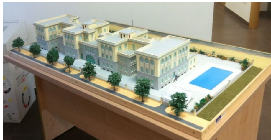
Plastico Lotto A «Villa Marina»