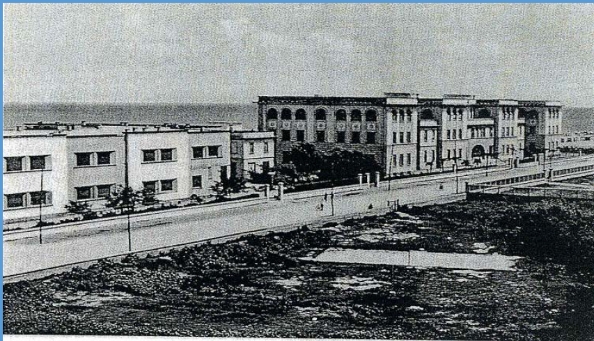
207*) Porto, veduta anni '30 di tutto il complesso dell'Istituto Postelegrafonici "Villa Marina" denominato a quei tempi "Colonia-Convitto di Villa Marina XXVIII Ottobre".