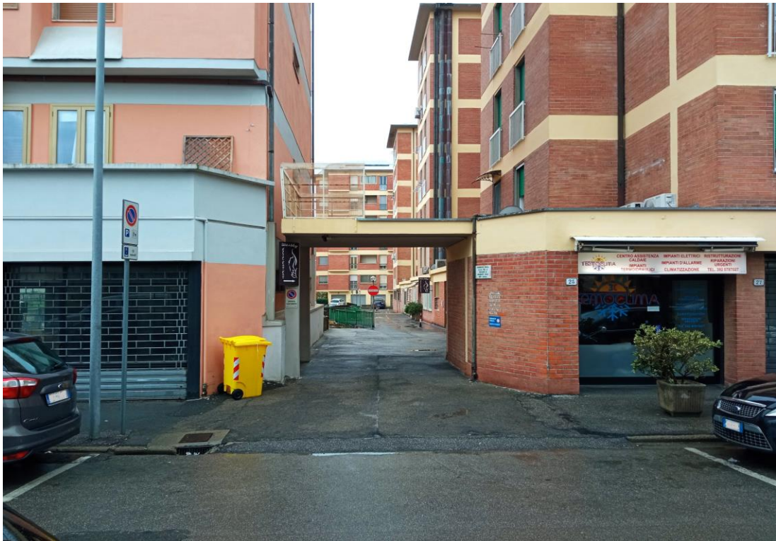
Immagine dell'ingresso nord al retro del fabbricato, acquisita in sede di sopralluogo con vista da via Vivaldi.