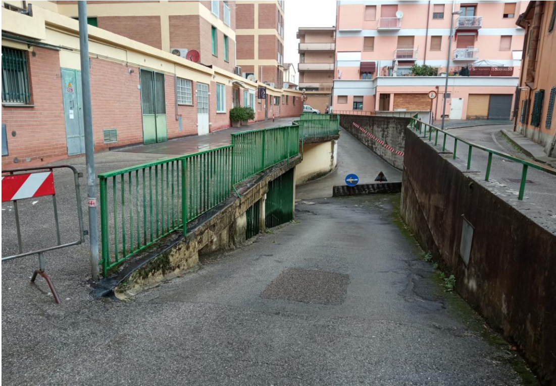
Immagine della rampa di collegamento al piano interrato da via Manfredini, con cui si accede al posto auto coperto