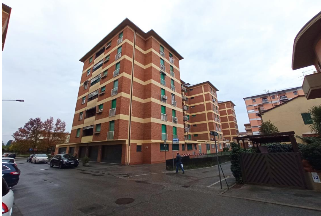
Immagine da sud-est del complesso di cui fanno parte le unità immobiliari