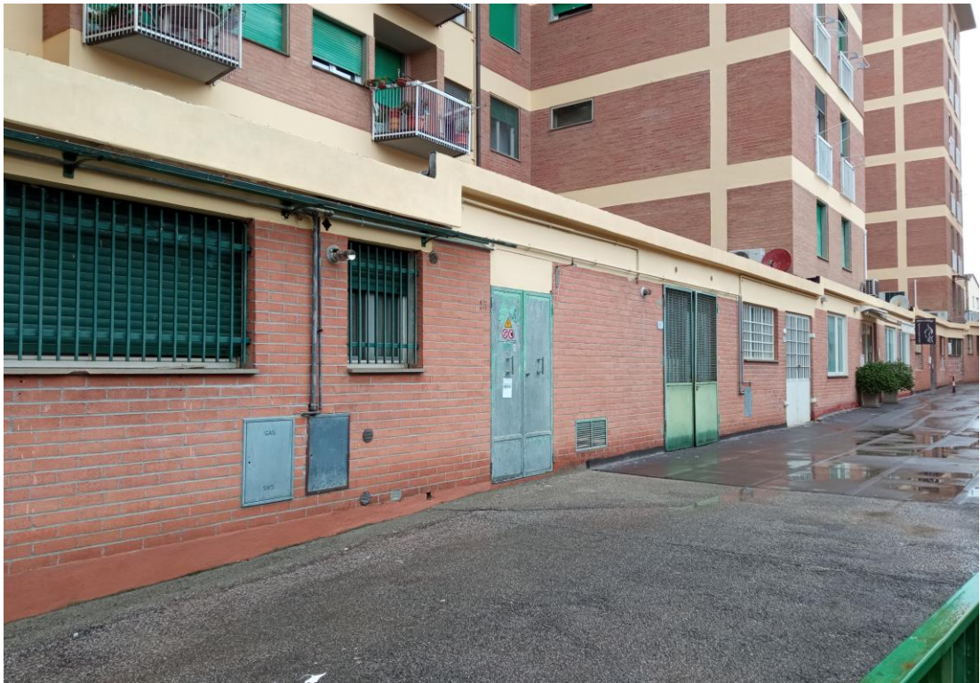
Immagine dell'ingresso alla centrale elettrica, posta al piano terra (porta metallica), acquisita in sede di sopralluogo con vista da via Manfredini.