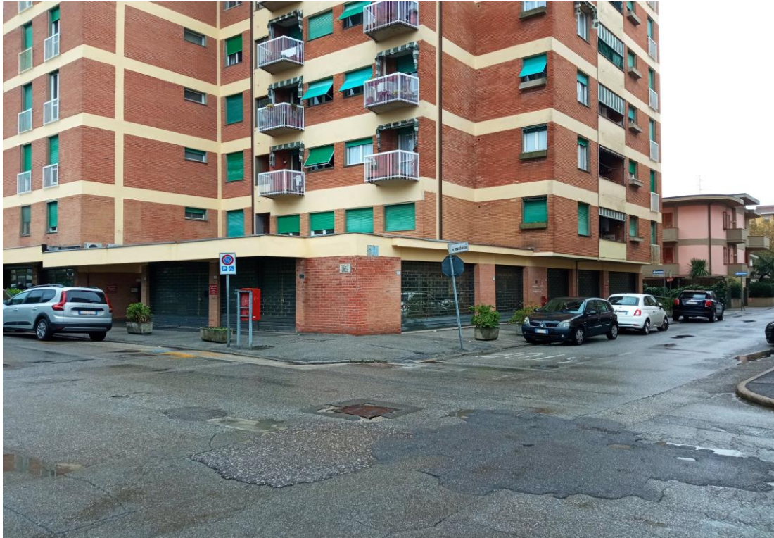
Immagine dell'unità commerciale (lato sud-ovest), posta al piano terra, acquisita in sede di sopralluogo con vista da via Borgognoni.