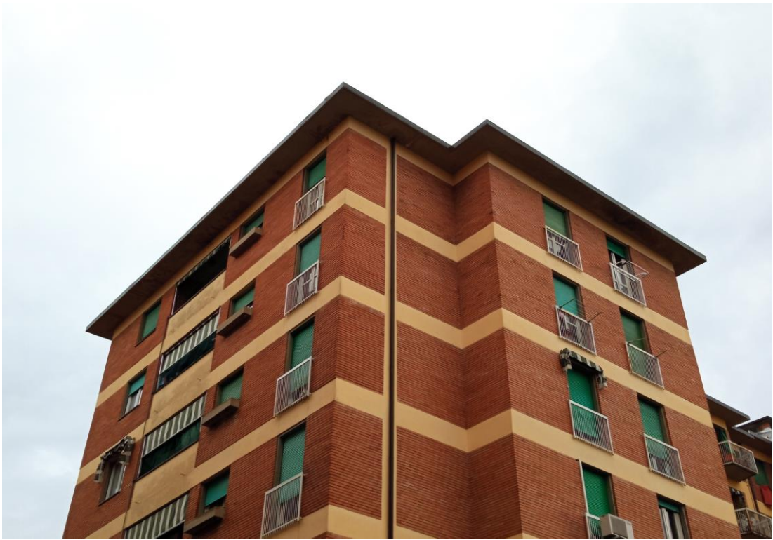
Immagine dell'unità abitativa (lato sud-est), posta al sesto piano, acquisita in sede di sopralluogo con vista da via Manfredini.