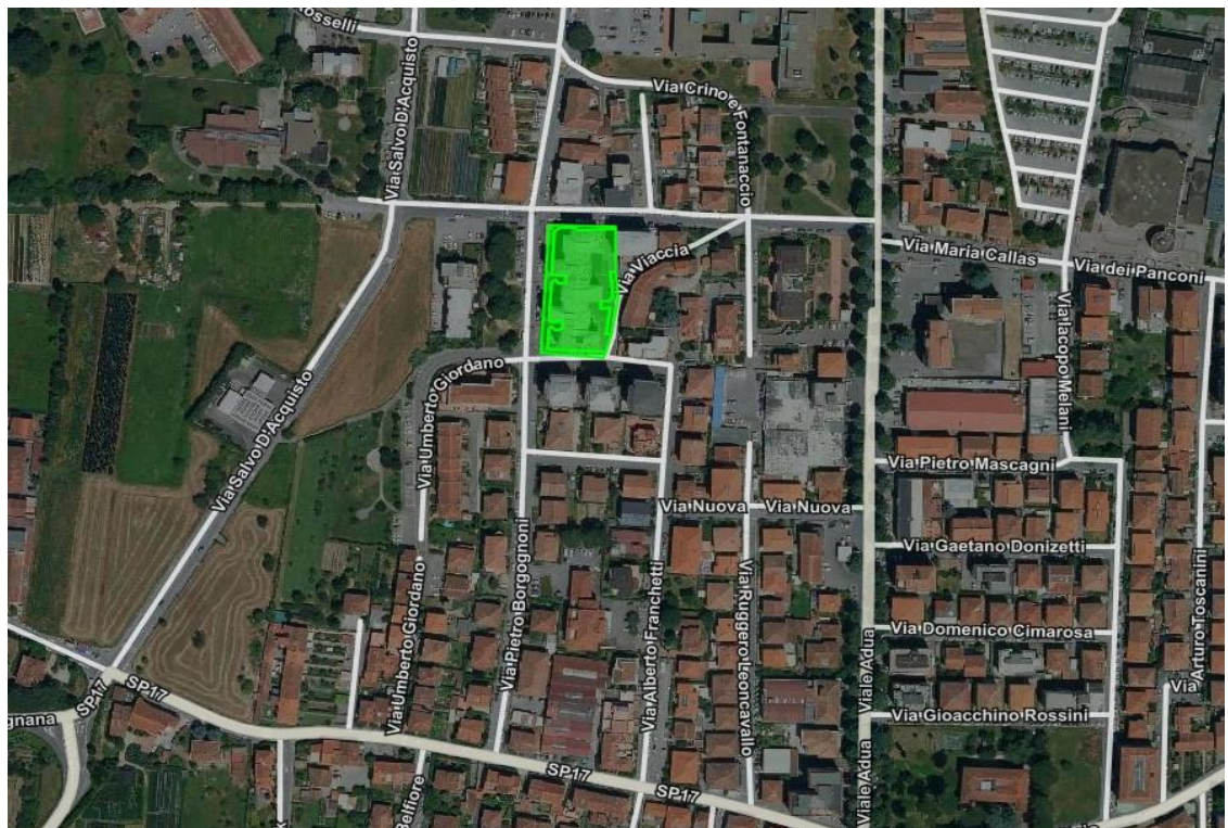
Comune di Pistoia: via Pietro Borgognoni, via Antonio Vivaldi, via Jacchia, via Vincenzo Manfredini.