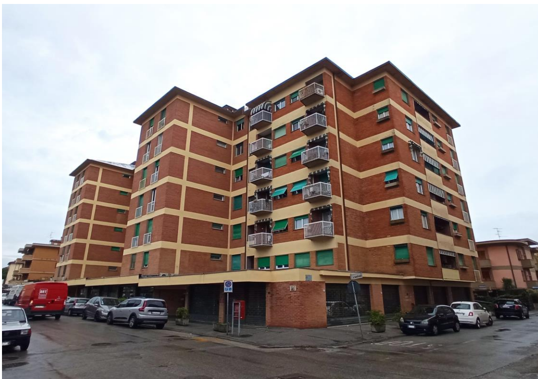
Immagine da sud-ovest del complesso di cui fanno parte le unità immobiliari