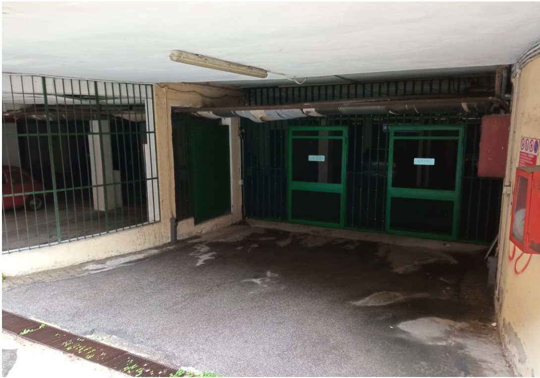
Immagine dell'ingresso al piano interrato, da cui si accede al posto auto coperto, acquisita in sede di sopralluogo