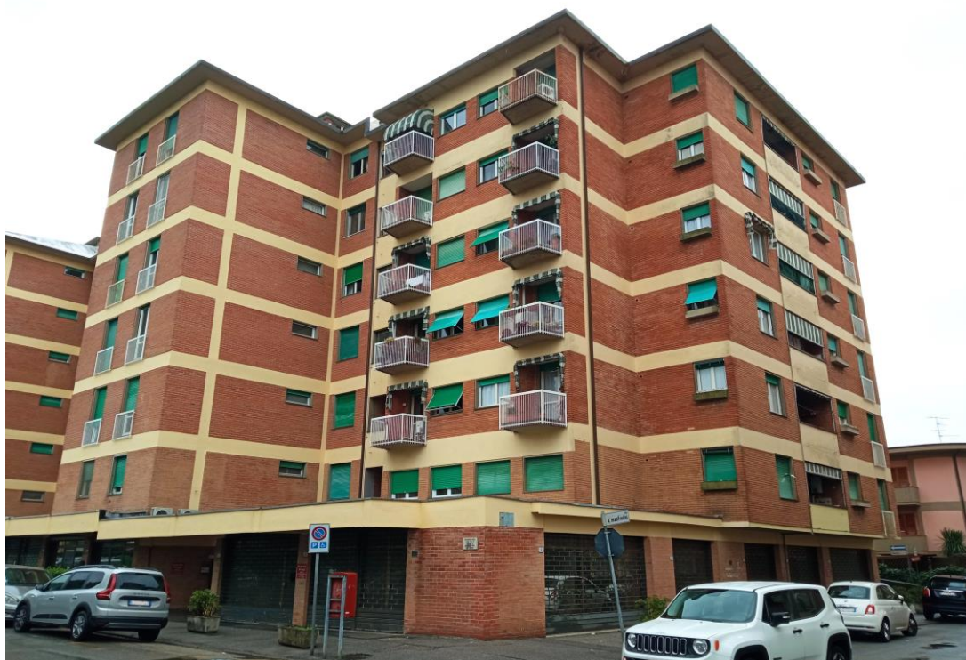
Immagine da sud-ovest del fabbricato di cui fanno parte le unità immobiliari