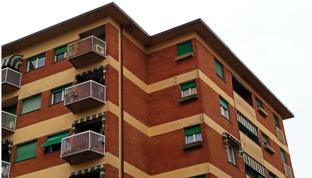
Immagine dell'unità abitativa (lato sud-ovest), posta al sesto piano, acquisita in sede di sopralluogo con vista da via Borgognoni