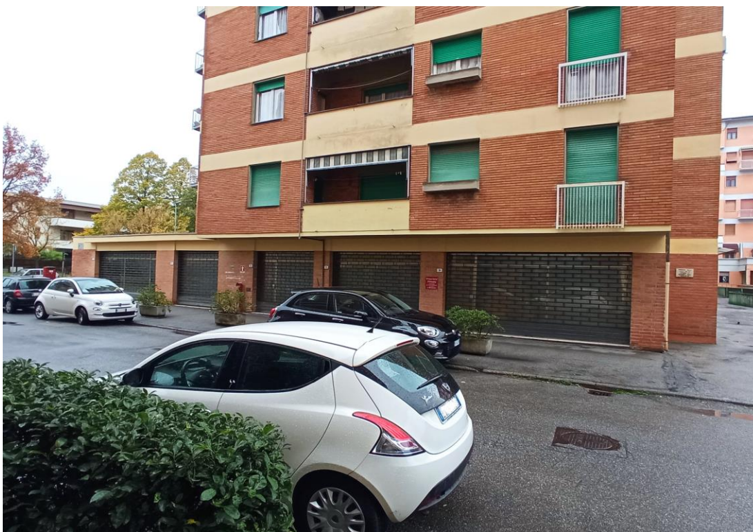
Immagine dell'unità commerciale (lato sud), posta al piano terra, acquisita in sede di sopralluogo con vista da via Manfredini.