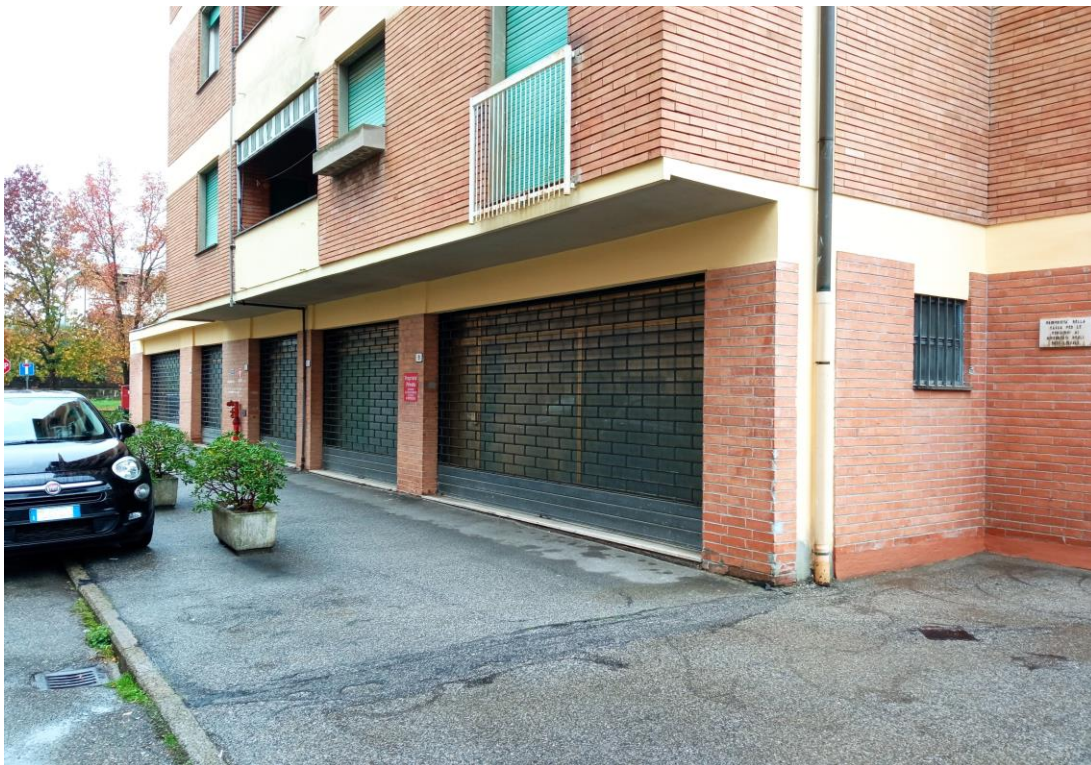
Immagine dell'unità commerciale (lato sud-est), posta al piano terra, acquisita in sede di sopralluogo con vista da via Manfredini