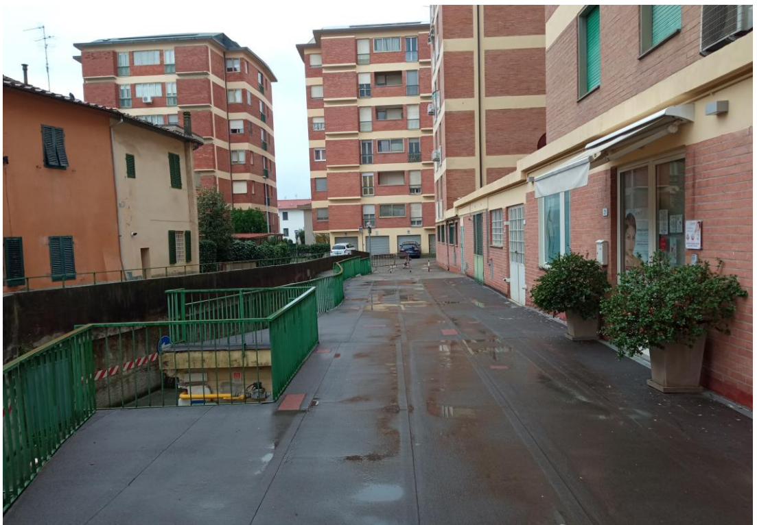
Immagine del percorso di accesso al retro del fabbricato, da nord, dove è posta la centrale elettrica, acquisita in sede di sopralluogo.