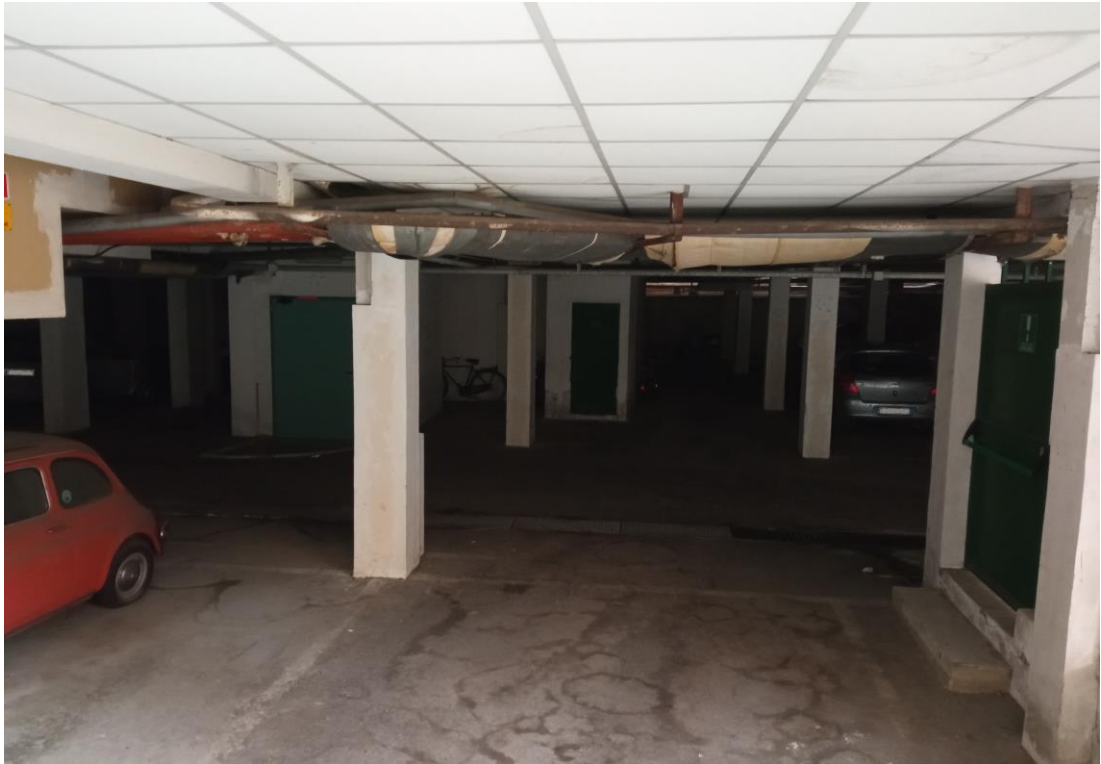
Immagine interna del piano interrato, in cui è localizzato il posto auto coperto oggetto, acquisita dall'esterno in sede di sopralluogo.