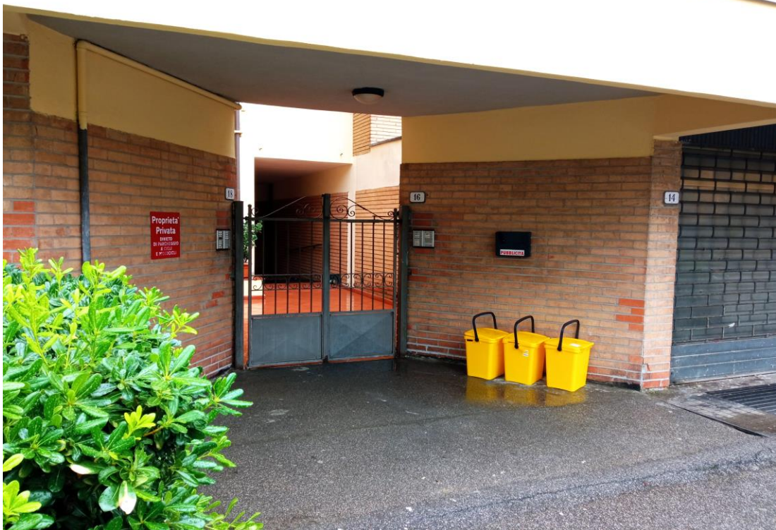
Immagine dell'ingresso condominiale al piano terra da cui si accede all'unità abitativa