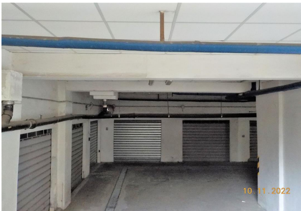
Immagine scattata il giorno 10/11/2022 nel corso del sopralluogo esterno - Accesso da via Borgognoni.