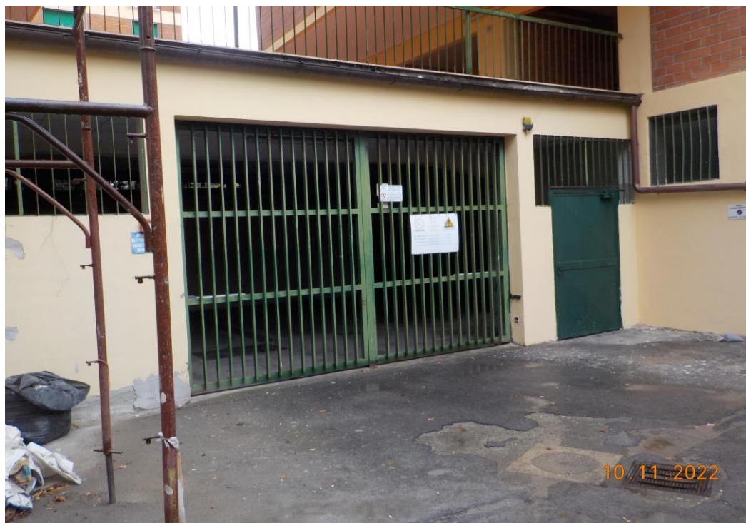
Immagine scattata il giorno 10/11/2022 nel corso del sopralluogo esterno - Accesso da via Borgognoni .