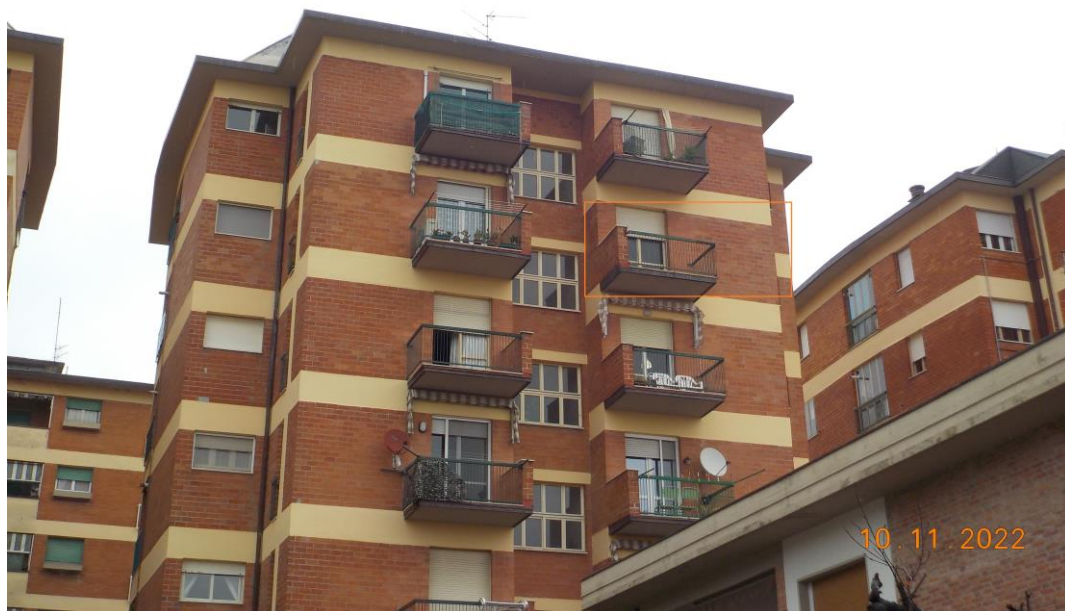
Immagine scattata il giorno 10/11/2022 nel corso del sopralluogo esterno lungo via Giustini.