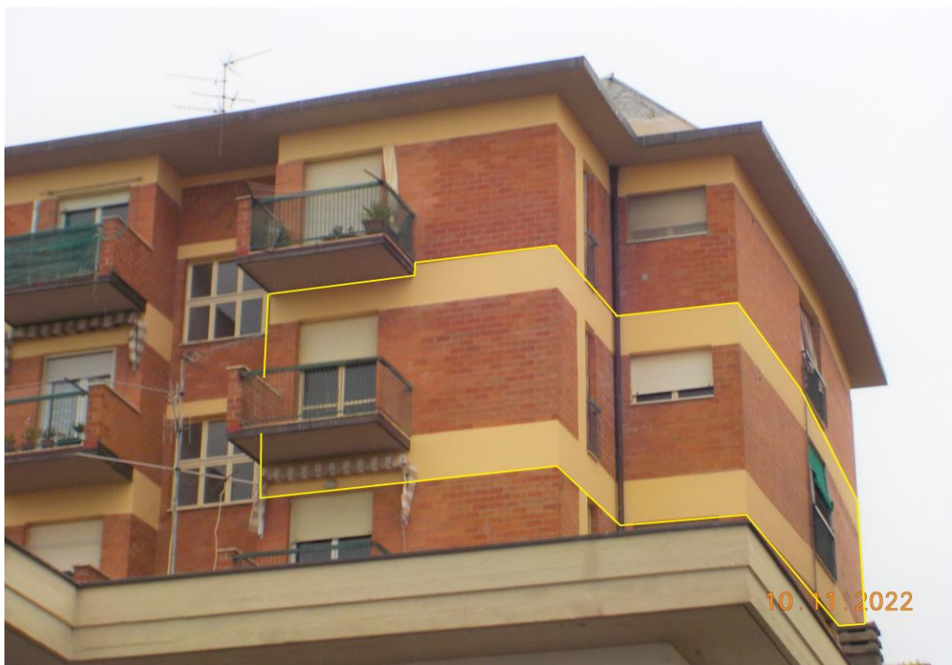
Immagine scattata il giorno 10/11/2022 nel corso del sopralluogo esterno lungo via Giustini.