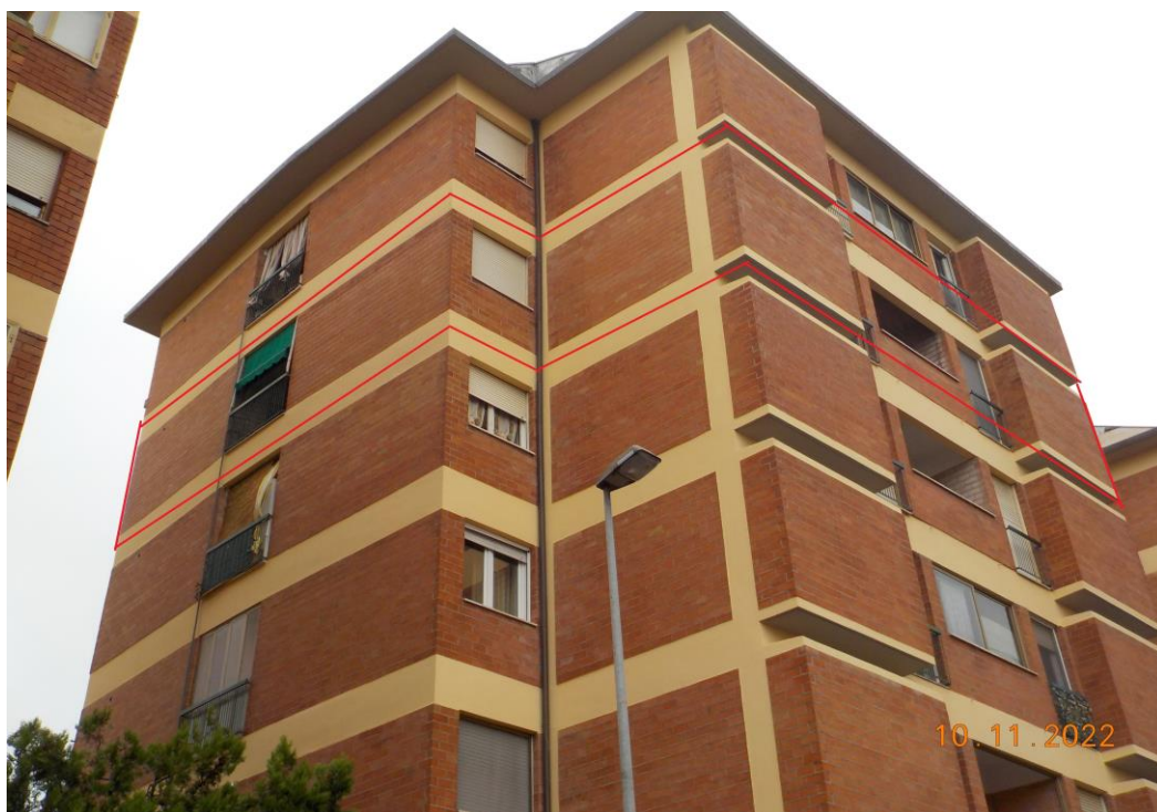
Immagine scattata il giorno 10/11/2022 nel corso del sopralluogo esterno lungo via Manfredini.