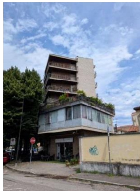
FOTO IDENTIFICATIVE BENE e PLANIMETRIA

Immobile ubicato a Busto Arsizio, interno ad un fabbricato di 8 piani fuori terra e un piano seminterrato, realizzato con Licenza Edilizia n.21/1964. Il comune fa parte della macroarea del mercato immobiliare «zona Industriale Basso Varesotto» con disponibilità sufficiente di beni aventi caratteristiche analoghe.