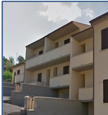
FOTO IDENTIFICATIVE BENE e PLANIMETRIA