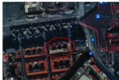
FOTO IDENTIFICATIVE BENE e PLANIMETRIA

Quota pari a 50% di negozio in palazzo storico non soggetto a vincolo, con mq 47 per locale soppalco; ubicato al centro storico cittadino, nel quartiere Mercato, a breve distanza dalla stazione ferroviaria, zona densamente urbanizzata, non distante dall'autostrada e dalla tangenziale; sviluppo di ingressi e vetrine pari a 4 m.