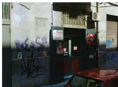
Foto esterno negozio, ubicazione e planimetria